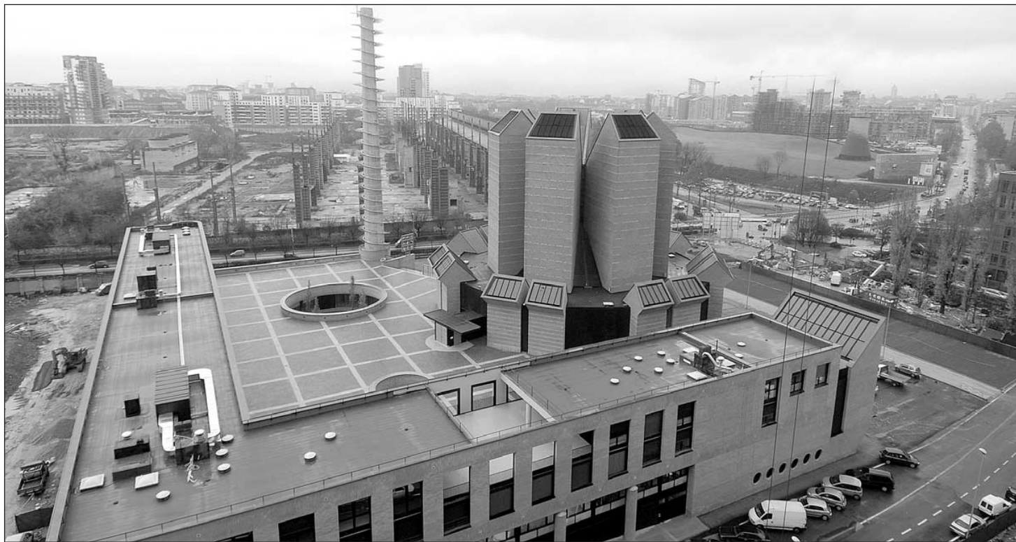
Ecco il complesso del Santo Volto, e in alto l'interno della chiesa, l'immagine della Sindone, l'arch. Botta con il card. Poletto. In basso: la vecchia ciminiera che è stata «inserita» nel contesto per ricordare l'antica destinazione industriale del luogo

Certo: sono lontani i tempi delle chiese-garage, degli edifici di fortuna ricavati in qualche stanza al piano terreno delle case popolari; anche perché allora la città aveva una grande fame di chiese ma pure di scuole, trasporti, ospedali, servizi pubblici... e oggi la situazione non è più quella degli anni '50, né degli anni '70. Il complesso del Santo Volto arriverà a costare, all'incirca, 30 milioni di euro tutto compreso: chiesa, uffici di Curia e centro congressi. Una parte della