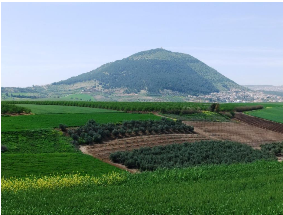
Il monte Tabor

O Signore, in questo nostro cammino quaresimale, mentre, come ogni anno, ci prepariamo a rivivere insieme a Te la Pasqua, oggi ci fai salire con Te sul Tabor e ci fai gustare un anticipo della tua Gloria. Anche noi, come Pietro, ti preghiamo: lasciaci costruire tre capanne. Però – ci scuseranno Mosè ed Elia – noi vorremmo che ognuna di esse fosse per Te. La prima capanna è per Te bambino, che non hai trovato alloggio, che hai perso la casa sotto i bombardamenti, che l’hai dovuta abbandonare a causa degli eventi climatici estremi... La seconda capanna è per Te migrante, che non hai una pietra dove posare il capo, che sei respinto, naufrago, clandestino... La terza capanna è per Te carcerato, condannato a morte, giustiziato... E, in queste capanne, consentici di rimanere accanto a Te, per contemplare la tua Gloria. Amen.