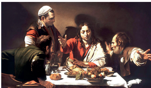
Michelangelo Merisi da Caravaggio, I discepoli ad Emmaus (1601-2) National gallery, Londra

Gesù sta inviando in missione i suoi dodici discepoli, chiamati poco prima apostoli, e per tre volte, nel brano di questa domenica, dice loro «non abbiate paura», frase che tradotta in forma positiva può suonare così «abbiate coraggio». In effetti andare a predicare e a guarire come faceva Gesù in un contesto che non lo aveva ancora accolto proprio bene poteva suscitare un po' di preoccupazione, di timore, di paura.