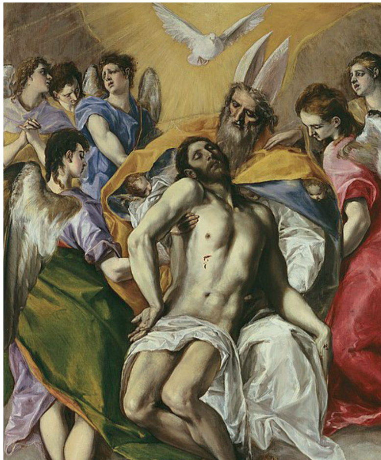
La Trinità, El Greco (1577-79) Museo del Prado, Madrid

«Se ci mettiamo in cammino, se usciamo od entriamo, se ci vestiamo, se ci laviamo o andiamo a mensa, a letto, se ci poniamo a sedere, in queste e in tutte le nostre azioni ci segniamo la fronte col segno di croce» così scrive Tertulliano a metà del II secolo e col segno della croce noi oggi pronunciamo la formula benedetta «nel nome del Padre e del Figlio e dello Spirito Santo». Sfiando la fronte ci ricordiamo che siamo figli di un Re, eterno, altissimo, onnipotente. Sfiando il petto ci ricordiamo che siamo fratelli del Figlio Gesù che si è fatto persona umana e come noi ha avuto fame, ha provato gioia e dolore perché aveva un cuore. Sfiando