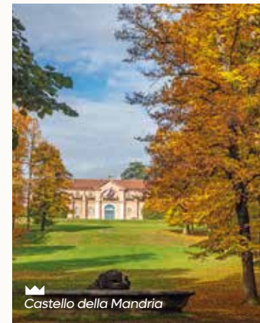
Castello della Mandria

Una "corona" di splendide residenze di piacere e di caccia a poca distanza dalla città, dove si svolgevano cerimonie e ricevimenti che scandivano i tempi della vita di corte.