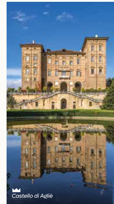
Castello di Agliè

Furono acquistati a questo scopo il Castello di Agliè , un trionfo di eleganza e splendore con il salone da ballo affrescato e la successione di ambienti perfettamente conservati, e il Castello di Govone , famoso per il giardino settecentesco dove fioriscono numerose varietà di rose e una rara specie di tulipano selvatico.