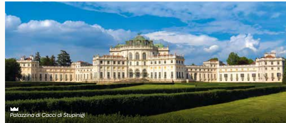
Palazzina di Caccia di Stupinigi

Hanno origini difensive i castelli di Rivoli – oggi Museo di Arte Contemporanea - e di Moncalieri inizialmente edificati come roccaforti e successivamente trasformati in accoglienti "luoghi di delizie". Il Castello della Mandria , all'interno dell'omonimo Parco, divenne residenza e luogo prediletto del primo re d'Italia.