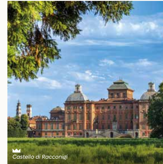
Castello di Racconigi

La nuova moda della villeggiatura tra Settecento o Ottocento portò alla trasformazione di antichi edifici in eleganti residenze circondate da suggestivi parchi dal gusto romantico.