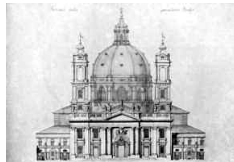
Progetto per il duomo di Torino: prospetto e sezione