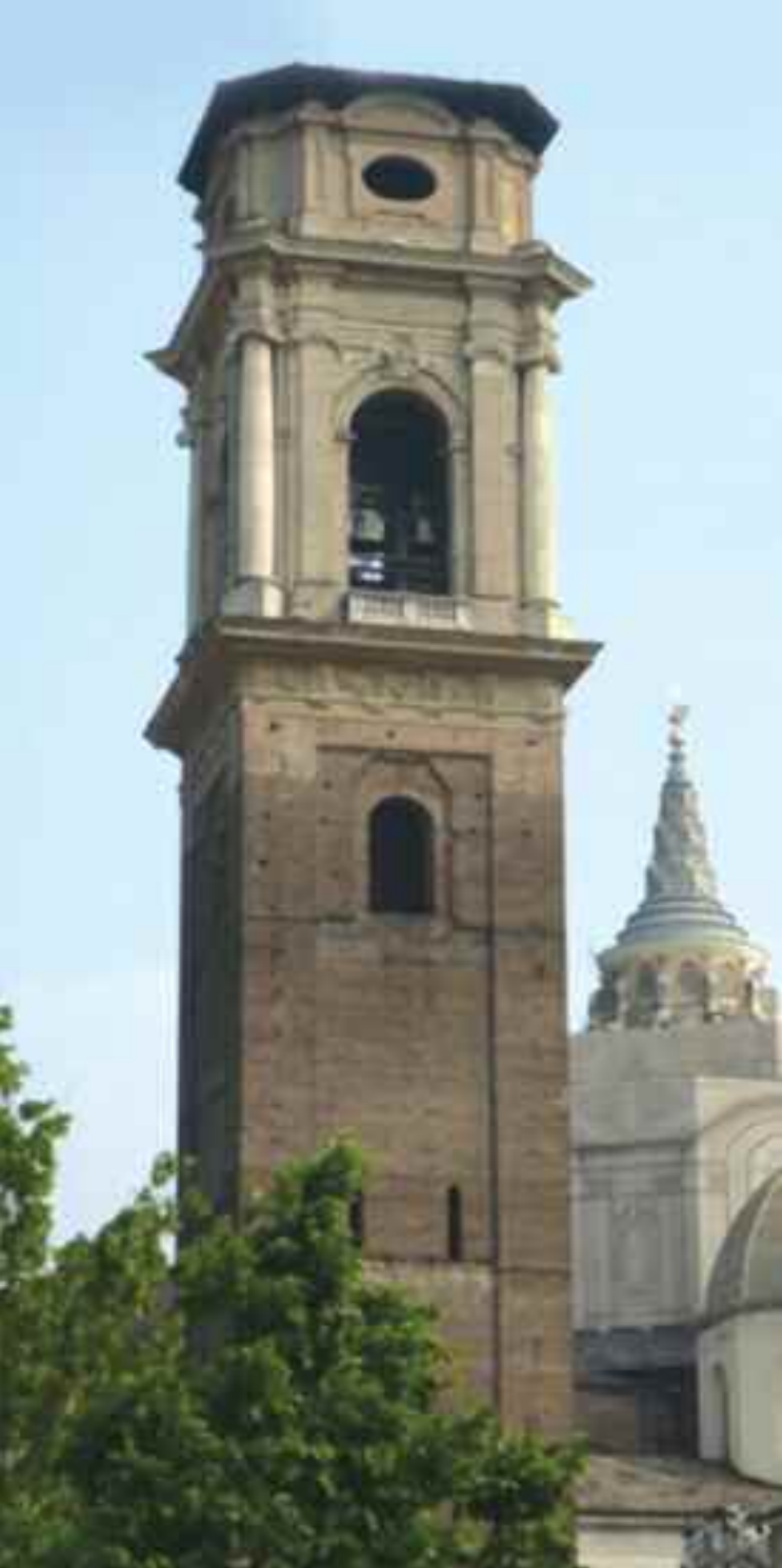
Campanile – Duomo di Torino In copertina: Duomo di Torino