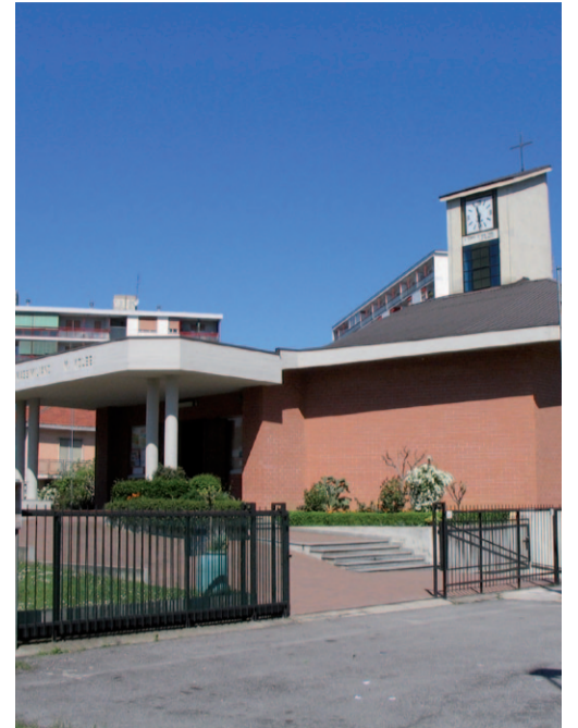
S. Massimiliano Maria Kolbe - Grugliasco

NOSTRA SIGNORA DEL SACRO CUORE DI GESÙ – L'IMPORTANZA DELLE RELAZIONI PER AGGREGARE E FORMARE I GIOVANI