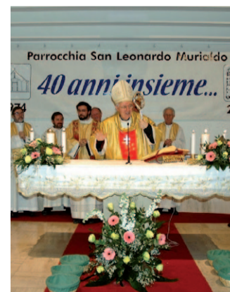
Lo scorso anno, la festa dei 40 anni

Uno stile familiare e di condivisione che si rispecchia nel bollettino parrocchiale «atteso davvero con trepidazione - aggiunge - tanto che non è infrequente, d'estate quando