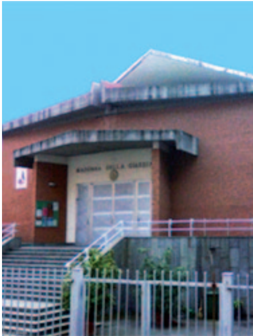
Madonna della Guardia