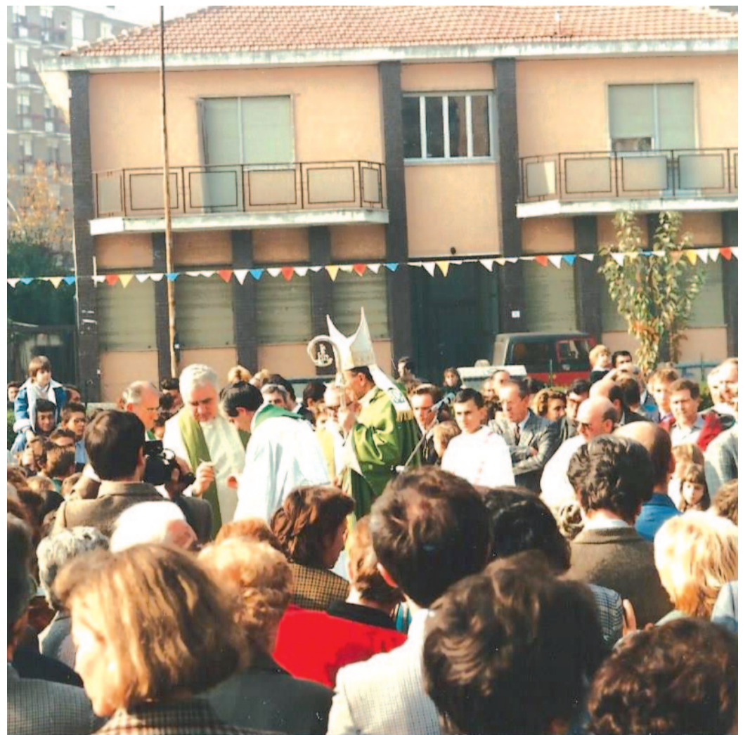
La benedizione della prima pietra di San Massimiliano Kolbe

una costruzione in pannelli prefabbricati da montare su una piattaforma di cemento nell'area riservata alla nuova chiesa: un locale di 200 metri quadrati e due piccole aule per il catechismo. Eravamo nel 1982 e l'anno successivo la nostra Comunità diventava succursale della chiesa di S. Chiara. Il cammino proseguiva, don Carlo aveva proposto alle famiglie una contribuzione mensile di 2 mila lire come «fondo chiesa» e la generosità delle famiglie aveva superato ogni aspettativa, continuando come forma di partecipazione alla vita parrocchiale, a sentirne e a dividerne i bisogni, finalizzata alla costruzione della nuova chiesa in muratura, pronta nell'anno 1992. Quanta gioia e lode al Signore! Inoltre, contemporaneamente alla costruzione del nuovo edificio, la nostra piccola, ma bella Comunità, raggiungeva un importante traguardo: il 14 agosto 1990, festa di S. M. Kolbe, con decreto del Cardinal Saldarini diventava parrocchia!!! Ora eravamo parrocchia, nel quartiere era in costruzione l'edificio luogo di preghiera e di vita