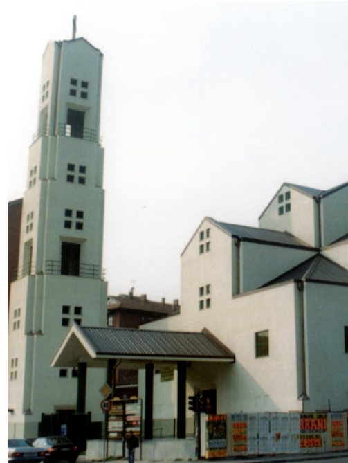
San Leonardo Murialdo