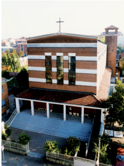
Nostra Signora del Sacro Cuore di Gesù