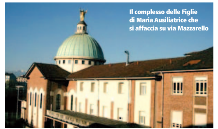
Il complesso delle Figlie di Maria Ausiliatrice che si affaccia su via Mazzarello