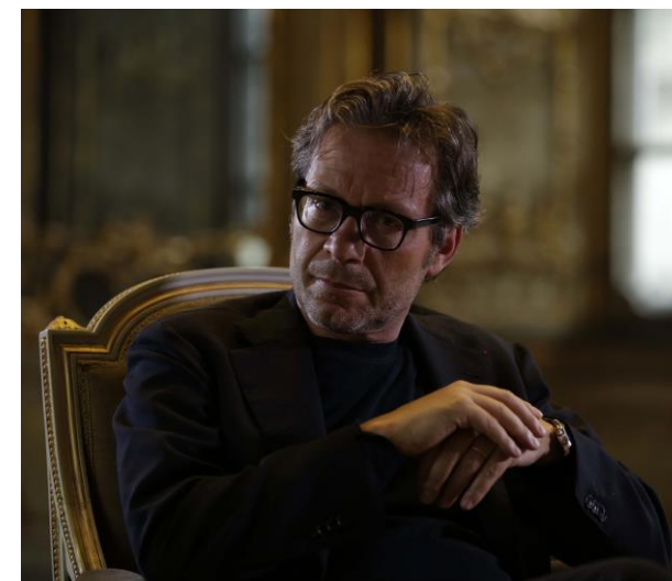
M.R., palazzo Litta, Milano 2016, Davide Borroni.

Venerdì 17 gennaio 2020 ore 17.00 – 20.00