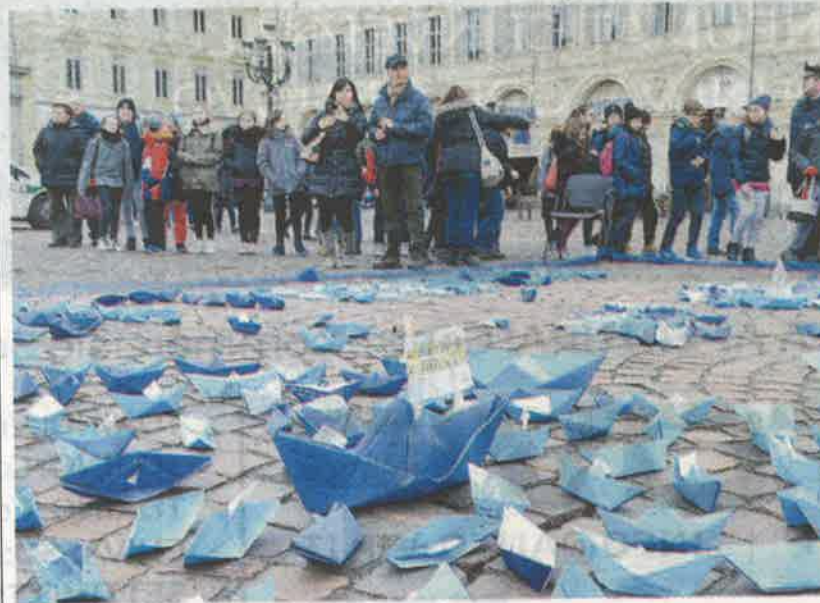
▲ In piazza San Carlo

Ed è proprio per educare soprattutto le nuove generazioni a un uso consapevole del mezzo digitale che la polizia ha voluto creare questo evento, diffuso in 100 capoluoghi di provincia su tutto il territorio nazionale, che rappresenta un'edizione speciale del progetto “Una vita da social” che da anni viene portato nelle scuole e che in tutto entrerà in contatto