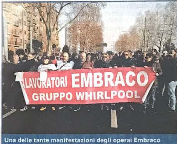
Una delle tante manifestazioni degli operai Embraco