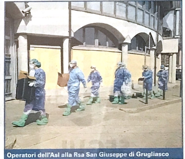
Operatori dell'Asl alla Rsa San Giuseppe di Grugliasco