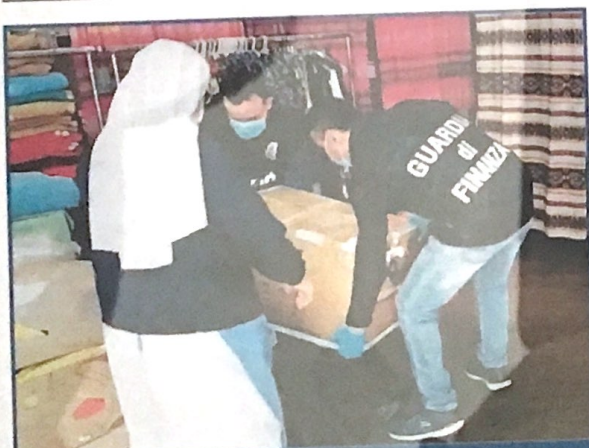
I vestiti sono stati consegnati alle suore cottolenghine

re Nosiglia. «Ringraziamo di cuore il Banco Alimentare e i numerosi benefattori di questi giorni difficili, proseguendo ancor più convinti e operosi nel servizio caritatevole quotidiano rivolto ai poveri torinesi» spiegano dalla mensa. Per informazioni, contribuire con donazioni di alimenti e denaro è disponibile l'infoline della segreteria del "Cenacolo eucaristico della Trasfigurazione Onlus" (telefono 375.6188246), anche via sms o Whatsapp, tutti i giorni, festivi inclusi, dalle 10.00 alle 19.00 con orario continuato.