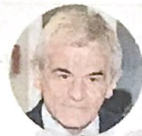
SERGIO CHIAMPARINO EX PRESIDENTE DEL PIEMONTE