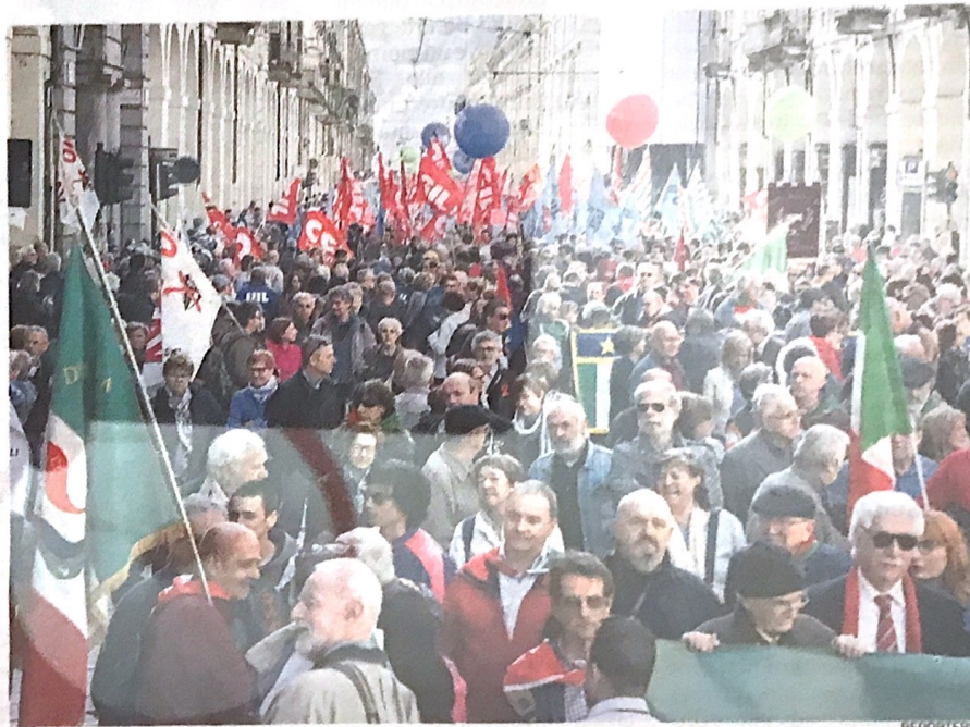
Il corteo del Primo Maggio dello scorso anno

«Questo Primo Maggio non sarà una festa. Deve essere una rinascita, un nuovo inizio per tutti, un'occasione per riflettere sulla ripartenza del nostro sistema produttivo e sociale individuando un'agenda condivisa tra istituzioni, parti sociali e terzo settore» dice il segretario generale della Cisl