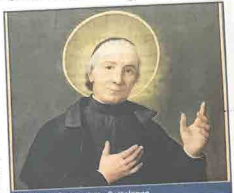
San Giuseppe Benedetto Cottolengo

«Il nostro santo ha saputo consumare la propria vita servendo i poveri. E la carità di Cristo lo ha talmente affascinato al punto da fargli dedicare tutta la propria, paradigmatica parabola terrena in soccorso dei bisognosi», afferma don Adriano Gennari, superiore dei sacerdoti torinesi di un ordine che, alla mensa dei poveri di San Salvario, oggi al tempo del coronavirus offre una media di 280 pasti caldi al giorno, rispetto ai circa 130 pasti abituali. Un impegno importante, sulle orme appunto delle opere del grande