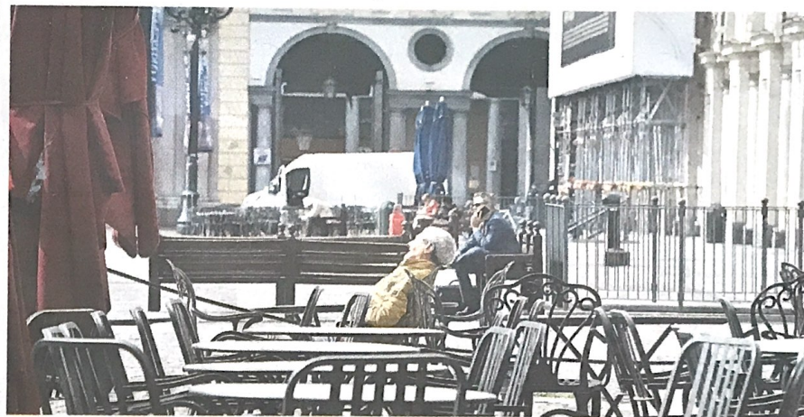
Il servizio take away è stato attivato da circa il 40% degli esercizi pubblici

«Sì, bisogna pensare che la vita tornerà alla normalità. I modelli ci dicono che i contagi stanno diminuendo, non possiamo pensare di ri-