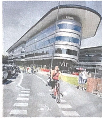
▲ Il campus Einaudi Ospita le facoltà umanistiche

Ma ci sono dei "ma". Basta leggere le istruzioni da seguire per predisporre il luogo deputato a eseguire il test per accorgersi che i requisiti richiesti sono già fortemente discriminanti: il candidato deve infatti trovarsi in un luogo fisico adatto, deve essere solo per la durata dell'esame, deve disporre di due apparecchi elettronici e non