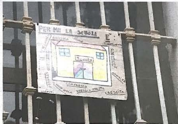
I cartelli dei bambini fuori dalla scuola Fontana

Il lato dell'edificio che affaccia sul tratto pedonale di via Balbo da alcuni giorni si è trasformato in un diario murale, denso di paure e desideri. «Se lavo spesso le mani e non tocco i compagni, posso tornare a scuola?». «Mi mancano tantissimo gli amici». «Alcuni compagni non parlano mai durante la lezione da casa». «Mia mamma è sempre nervosa e la vedo piangere spesso». Confi-