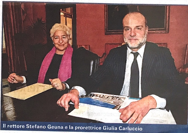
Il rettore Stefano Geuna e la prorettrice Giulia Carluccio

I fondi verranno così ripartiti: quattro milioni di euro saranno destinati all'inclusività e all'accesso agli studi universitari. «È una cifra importante - commenta Geuna - che mettiamo a disposizione in varie forme, tra cui interventi sulla tassazione che prevedono misure di calcolo basate sull'Isee corrente e non sullo storico della ricchezza delle famiglie». Sono previste inoltre diverse azioni a sostegno degli studenti lavoratori, «che in questo momento più di altri vivono difficoltà economiche». Ancora, dall'Ateneo fanno sapere di essere a lavoro per «ridurre il costo del materiale didattico, fornendo licenze per libri in forma-