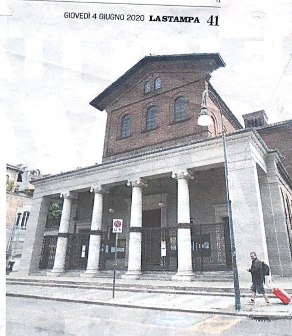
La chiesa della Beata Vergine delle Grazie