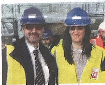
▲ Metrò Massimo Cudia e sindaca

di Torino e nei prossimi mesi inizieranno i primi "cantieri" esplorativi per agevolare i lavori di progettazione: «Dobbiamo rivedere il piano provvisorio per la tratta Rebaudengo-Politecnico realizzato da Systra, e daremo tutta l'evidenza fisica al fatto che siamo partiti nei quartieri - spiega Cudia - Ci sarà un team tra le 35 e le 40 persone dedicate al progetto, di cui la maggior parte dipendente e l'altra in collaborazione.