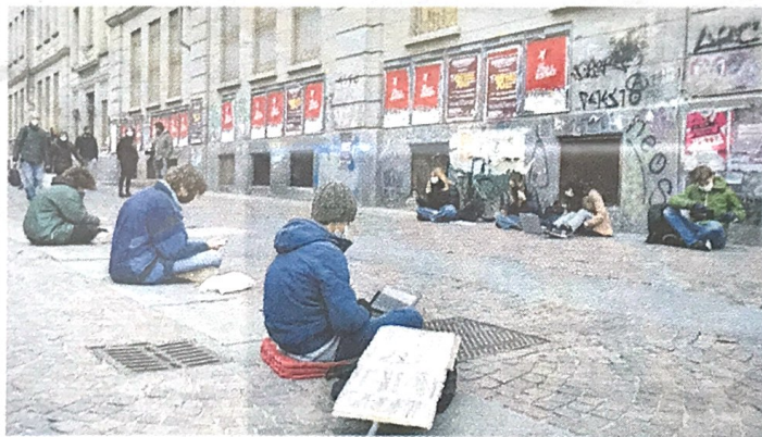
▲ La protesta I ragazzi a lezione davanti al liceo Gioberti