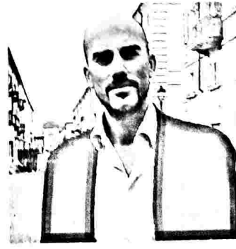
FABIO GIULIVI SINDACO DI VENARIA

Mi dispiace molto per questo episodio, la violenza non porta a nulla. Aspettiamo l'esito delle indagini