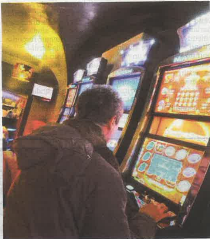
La legge del Piemonte ha drasticamente ridotto le slot machine

-15% il trend dei volumi di gioco rispetto al resto d'Italia nel periodo 2016-2019