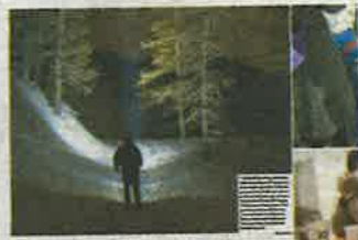
La neve non ferma la marcia. Ogni mese 1.500 migranti provano a passare il confine