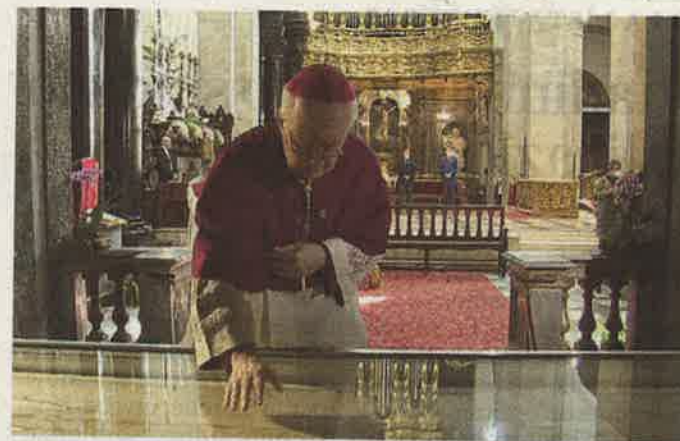
L'arcivescovo Cesare Nosiglia lo scorso anno durante la diretta tv

nostre comunità ad accogliere nella speranza questo messaggio pasquale di morte e risurrezione per non arrendersi e scoraggiarci mai di fronte ad ogni tragedia e difficoltà che dobbiamo affrontare nella vita».