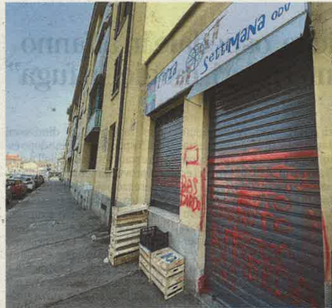
L'ingresso, imbrattato, dell'associazione Terza Settimana

pisce». Dopo la comparsa delle scritte, è partita una denuncia alla polizia. Per ora si fanno solo supposizioni sul responsabile del gesto: «Credo sia una persona che ha provato a ricevere il nostro aiuto senza passare dai servizi sociali. E quando ci sono queste incomprensioni, si tende a semplificare il tutto con concetti razzisti. L'italiano, per assurdo, è l'ultimo arrivato rispetto allo straniero nella catena della povertà. Per