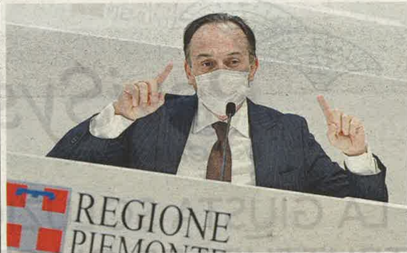
▲ Giovedì Il presidente del Piemonte Alberto Cirio incontrerà il governo

Sono mille e 273 i progetti che compongono questa enciclopedia delle esigenze piemontesi: 672 riguardano la rivoluzione verde e la transizione ecologica; 230 sono per digitalizzazione, innovazione, competitività e cultura; 187 riguardano le infrastrutture per la mobilità sostenibile; 107 l'inclusione e la coesione, 55 l'istruzione e la ricer-