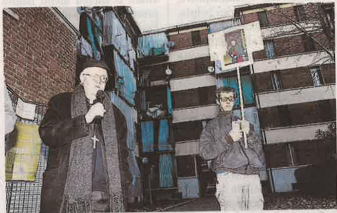
L'Arcivescovo Nosiglia in una visita alle popolari

■ La Santa messa di Pasqua nei cortili delle case popolari di zona Borgo Vittoria. Sarà l'arcivescovo di Torino, Cesare Nosiglia, a celebrare il rosario e la messa il giorno di Pasqua all'interno del complesso Atc di via Sospello. L'appuntamento per domenica è nel cortile centrale delle case popolari alle ore 16.30. Insieme a Nosiglia ci sarà anche il parroco della San Giuseppe Cafasso di via Gandino, don Angelo Zucchi. Sarà una messa diversa dal solito, non più celebrata con i fedeli raccolti nel cortile. Per evitare assembramenti, infatti, i residenti delle case popolari seguiranno la funzione dai balconi o dai davanzali del proprio alloggio. L'evento sarà trasmesso in diretta da Radio Fm e