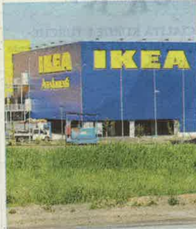
▲ Grugliasco La sede Ikea

sing" prevede un periodo di accoglienza di un anno nel corso del quale le persone coinvolte intraprenderanno anche un percorso per valorizzare le proprie capacità con l'obiettivo di costruire nel tempo una propria indipendenza economica, sociale e abitativa.