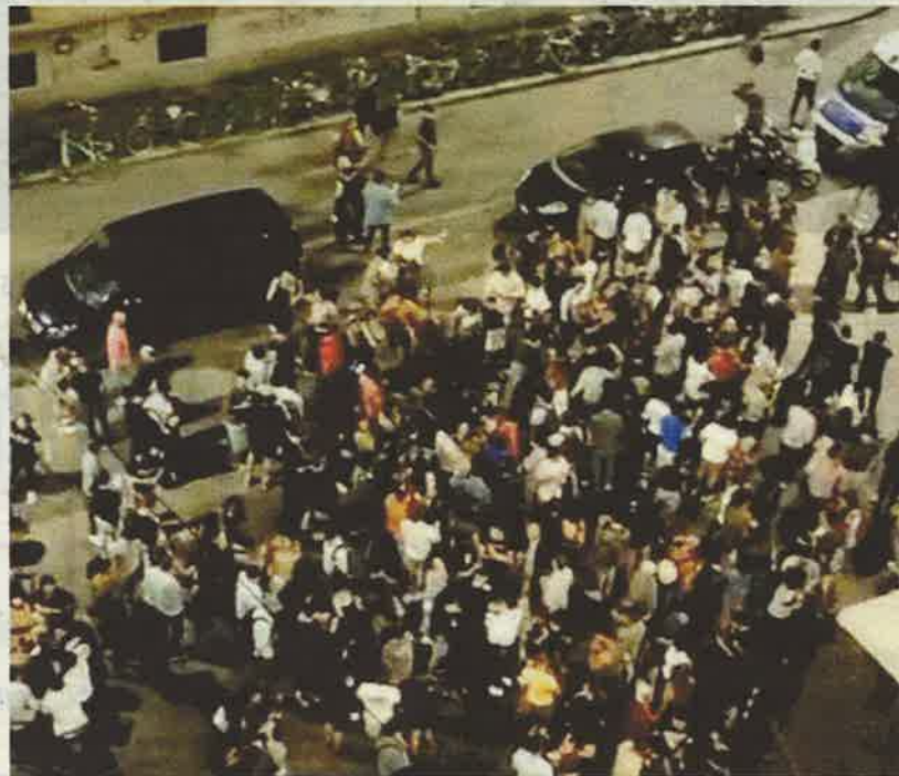
▲ La folla Piazza Santa Giulia in una "normale" sera di movida

“ Quelle adottate dal Comune non sono soluzioni, anzi è sempre peggio: la scelta di rendere pedonale la piazza ha aumentato la folla ”