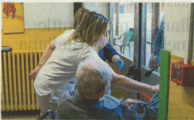
Il contributo è proporzionale ai posti letto.

Il criterio prevede che a ciascun ente beneficiario verrà corrisposto un contributo pari all'importo di 724 euro, moltiplicato per