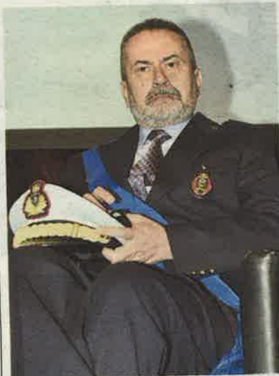
▲ Comandante Emiliano Bezzon annuncia una stretta sui monopattini che circolano in città

fanno a chi non usa in maniera corretta un monopattino. «In particolare – racconta Bezzon – sono due le tipologie di guida scorretta: sanzioniamo coloro che vanno sotto i portici o sui marciapiedi, non solo in via Sacchi, ma lungo tutti i 18 chilometri di portici, e quelli che usano il mezzo in coppia. Ci sono stati dei casi in cui erano anche in tre su uno stesso monopattino». Poche multe o tante multe? «Non sta a me dirlo – risponde Bezzon – gli agenti fanno la loro attività di controllo. Prima o poi qualcuno che viaggia sotto i portici potrebbe incappare in un controllo». Una risposta a chi dice che non ci sono civich che verificano: «Non può esistere dissuasore per i monopattini, così come non sarebbe possibile mettere sotto i portici agenti 24 ore su 24 a controllare il passaggio, ma i controlli ci sono, più volte alla