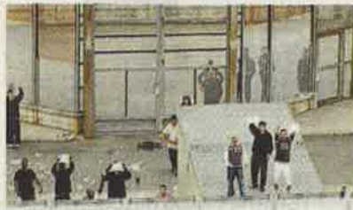
▲ In corso Brunelleschi il Cpr