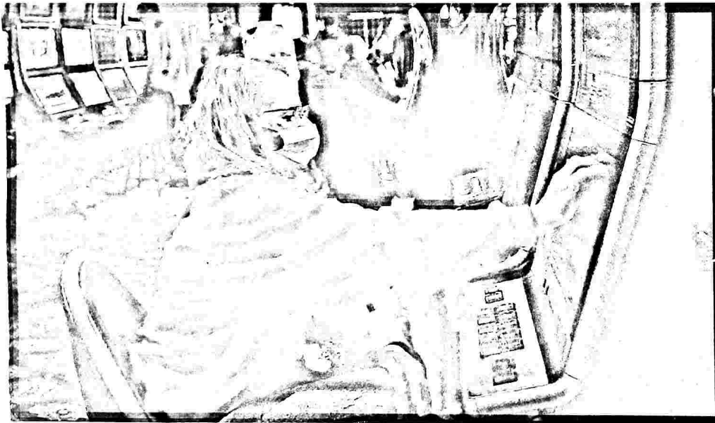
La nuova norma sull'azzardo, fortemente voluta dalla Lega, è stata approvata a luglio scorso

Nei giorni scorsi sono arrivati in Regione dei quesiti, mandati dai Comuni, su come interpretare la norma e sulla possibilità di consentire anche ai bar di installare le macchinette, come auspicato soprattutto dalla Lega che ha battagliato per ampliare le maglie della norma. Ma dagli uffici regionali che si occupano di aspetti legali è arrivato l'altolà: i bar «privi di licenza tabacchi o patentino» non sono legittimati a presentare istanza per la registrazione degli apparecchi per i giochi dismes-