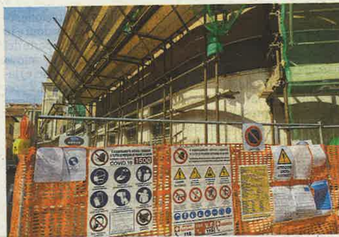
I permessi di costruzione sono una delle emergenze

economisti, 6 ingegneri ambientali e 4 geologi. Numeri piccoli, per questo verranno creati gruppi di lavoro su base provinciale. I colloqui, attingendo da un elenco nazionale, partiranno nei prossimi giorni e il piano dettagliato delle attività che faranno questi esperti dovrà essere pronto entro fine dicembre. Il numero è stato deciso in base alla popolazione regionale ma la Regione ha provato, per ora senza riuscirci, a chiedere che venisse considerata anche la frammentazione del territorio che ostacola. L'obiettivo è