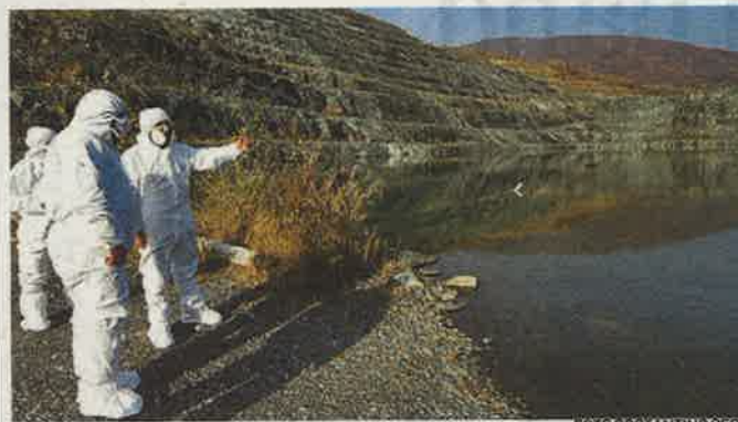
Il sopralluogo nella cava dell'ex Amiantifera

«Sarà un intervento da 2 milioni e 200 mila euro per un anno e mezzo di cantiere che aprirà i battenti all'inizio del prossimo anno - spiega Poma, ex di-