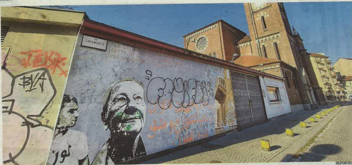
Il teatro di via Chiomonte è stato per anni il simbolo del recupero delle periferie e punto di riferimento per i giovani delle classi più fragili

zione. Una vocazione mostrata fin da subito, e mantenuta nel tempo. Anzi, ulteriormente rafforzata a partire dal secondo dopoguerra, quando l'Araldo è diventato il centro di un elaborato processo di educazione permanente che, grazie alla recitazione, puntava a unificare la popolazione