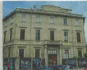
Via Cigna L'ex Astanteria Martini